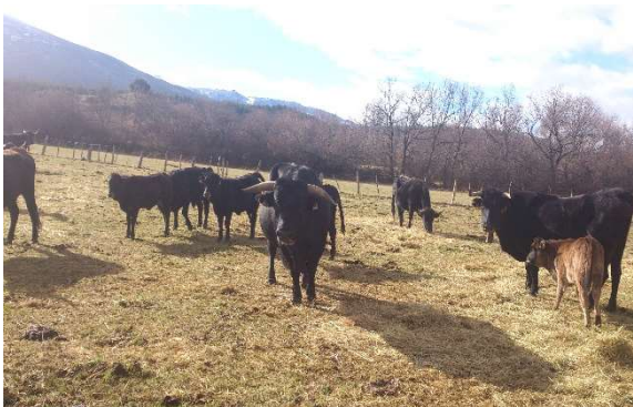
AVILEÑA NEGRA IBERICA (BOCI-BLANCA)